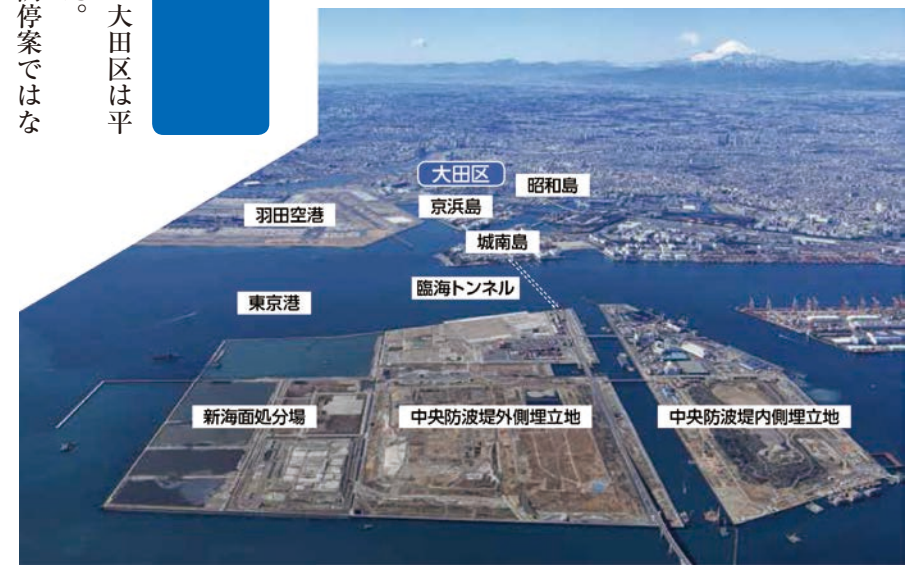
【中央防波堤埋立地と大田区臨海部】(平成29年2月)

topic 自民党大田区民連合 政務調査会長に就任しました 平成29年度会派執行部の人選が行われ、政策の責任者である政務調査会長に就任致しました。各種団体との意見交換を始め、地元の方々と意見交換させて頂いた内容について日々執行機関側(区役所など)と意見交換をしております。是非、身近な問題についてのご意見ご要望を頂ければと思います。