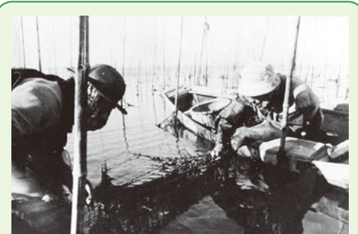
海苔の収穫の様子