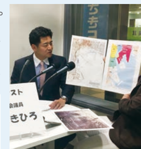
スト 員 きひろ

https://www.youtube.com/watch?v=QTHRarRwKw